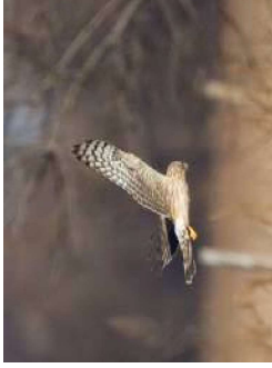
© Biotope – Photographie prise hors site