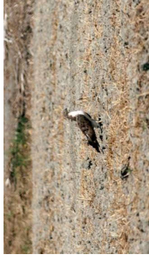
© Biotope – photographie prise hors site

couples nicheurs en Ile-de-France dont une vingtaine se trouvait dans le massif de Fontainebleau (Le Maréchal & Lesaffre, 2000).